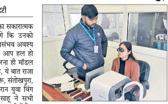
चरखी दादरी। कैम्प में मरीज की जांच करते स्वास्थ्यकर्मी।