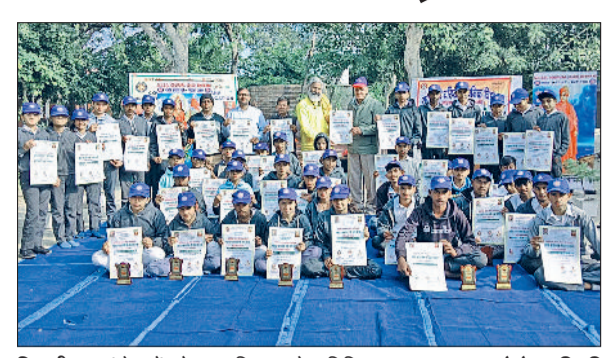
भिवानी। स्वयंसेवकों को सम्मानित करते अतिथि।

■ संस्कार एवं संस्कृति से ही संभव है राष्ट्र का उत्थान : महंत चरणदास