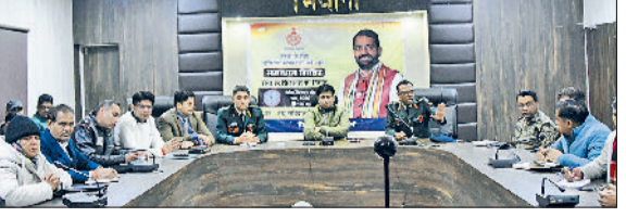
भिवानी। सैनिक भर्ती को लेकर आयोजित बैठक में दिशा निर्देश देते उपायुक्त।

विभिन्न पदों की भर्ती की जाएगी। भर्ती प्रक्रिया को शांतिपूर्वक ढंग से संपन्न करवाने के लिए भीम स्टेडियम के आस-पास पुलिस का सख्त पहरा होगा। किसी भी प्रकार की गैर कानूनी गतिविधि करने वालों के खिलाफ सख्त कार्रवाई अमल में लाई जाएगी। भर्ती प्रक्रिया