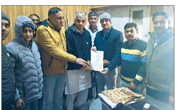
भिवानी। मांगों को लेकर अधिकारी को ज्ञापन सौंपते हुए।