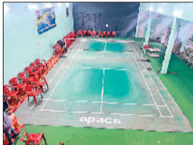
भिवानी। प्रतियोगिता के लिए तैयार किया गया स्टेडियम