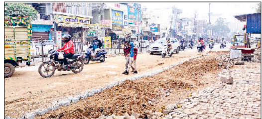
भिवानी। दिनोद गेट सर्कुलर रोड पर बनाई गई सड़क।

शहर के व्यस्ततम घंटाघर चौक से दिनोद गेट की तरफ जाने वाले सर्कुलर रोड पर काफी समय से सड़क धंसने की समस्या बनी हुई थी। सड़क धंसने की गंभीर समस्या का आखिरकार जिला प्रशासन ने समाधान करवा दिया है। लोकनिर्माण विभाग की तत्परता से सड़क को अब स्थायी रूप से दुरुस्त किया गया है। गौरतलब है कि दिनोद गेट से घंटाघर चौक की ओर जाने वाली मुख्य सड़क कई जगहों पर धंसी हुई थी और उसमें करीब एक से डेढ़ फुट गहरे गड्ढे बने हुए थे, जो लंबे समय